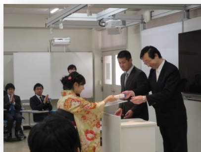
卒業式での学部長表彰