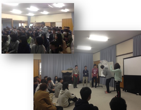
新入生オリエンテーション